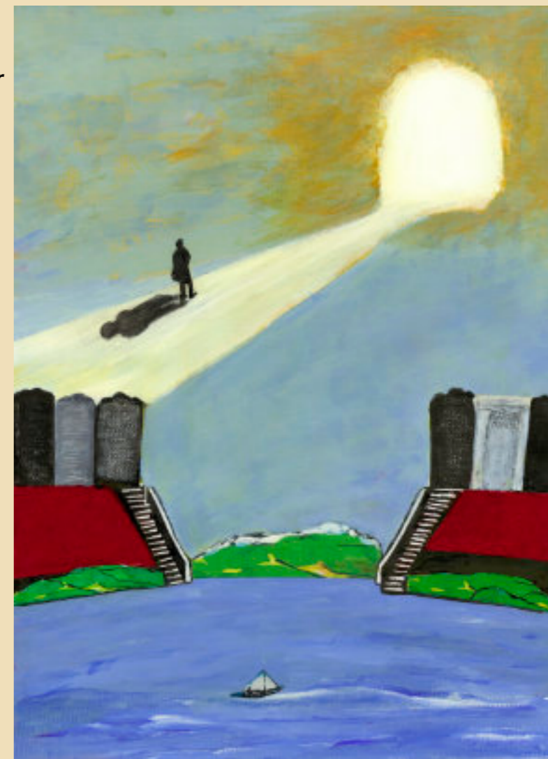
Projectbeeld door Jelle Stoop

En in de krant staat een artikel, waaruit blijkt dat het publiek zich niet schaamde voor zijn tranen.